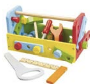
caja de herramientas de las inteligencias múltiples